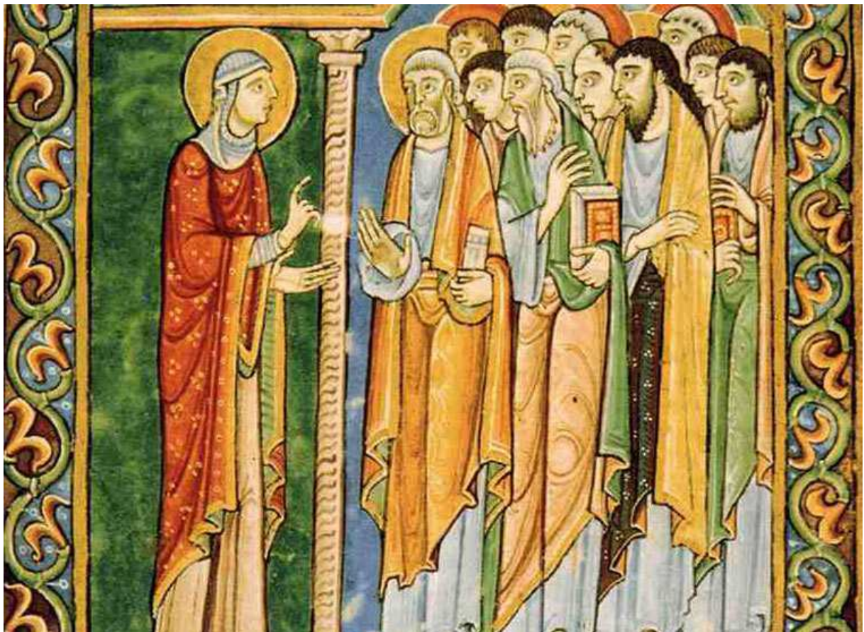
St. Albans Psalter, England, 12.Jhd.